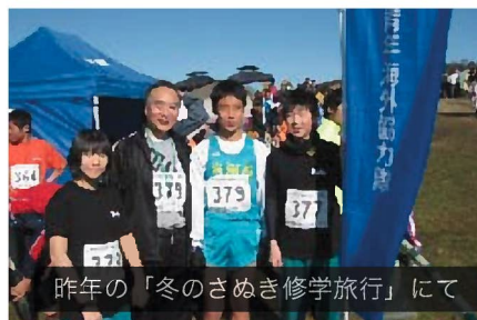
昨年の「冬のさめき修学旅行」にて