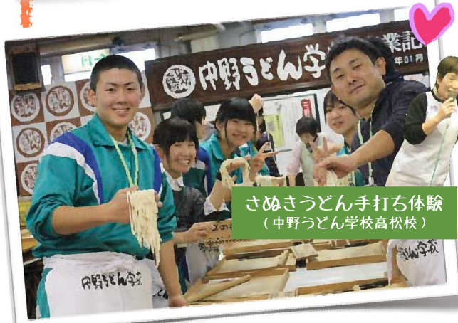
さぬきうどん手打ち体験 (中野うどん学校高松校)