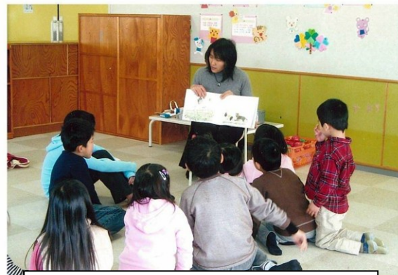
子どもたちに英語の本の読みきかせをしています